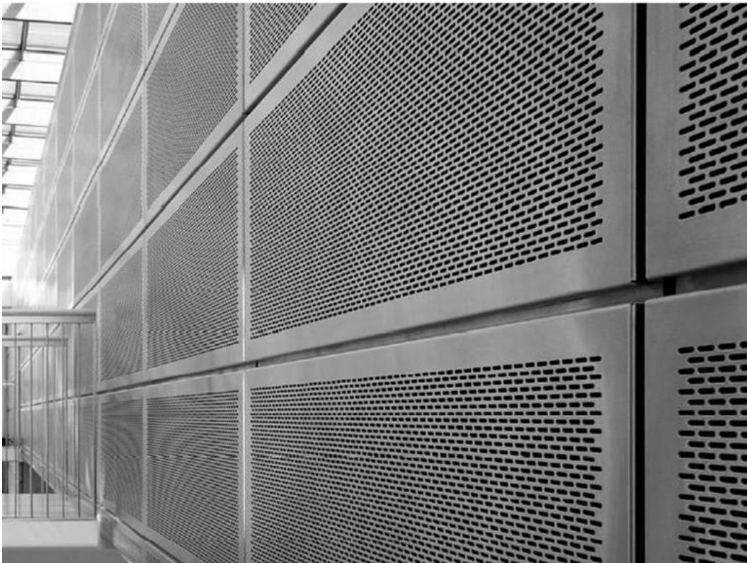
Figura 2 – Exemplo de um gradeamento que impede o uso de alicates de corte ou serras de metal